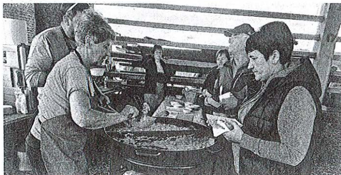
Obiskovalci so med drugim okušali proseno kašo z jurčki.

pa so ponudili proseni narastek. Obiskovalci – dogodek je privabil različne starostne skupine – so lahko videli tudi nekatera opravila in pripomočke, povezane s spravilom žita, med njimi pajkl (vetrovnik), namenjen čiščenju žitnega zrnja oziroma ločevanju zrnja od plev. Otroci so bili najbolj navdušeni nad žmrljami, napravo za ročno mletje žita.