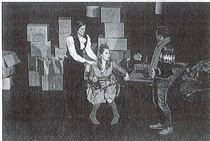
Za smeh so poskrbeli igralci Društva SNG Kranj v predstavi Ena na milijon.

Dovjega do Himalaje, za smeh so poskrbeli s komedijama Ritrit (Gledališko društvo Kontrada Kanal) in Ena na milijon (Društvo SNG Kranj). Otroci so uživali ob gledališki predstavi KuKuc teatra Pogumna