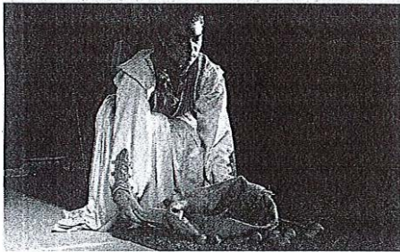
Prizor iz predstave Punce, ki prihaja v Kranj