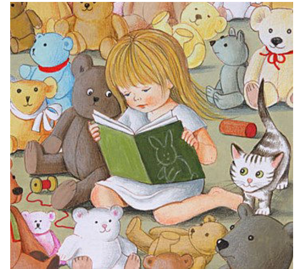
Ilustracija: Jelka Reichman