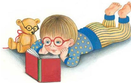
Ilustracija: Jelka Reichman

Prebrano in povedano naj bo do konca marca 2026.