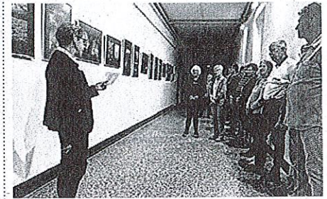
Z odprtja fotografske razstave

vsak izmed nas je skozi svoj objektiv in svoj pogled iskal tiste posebne trenutke, ko se voda razkrije v svojih neskončnih oblikah – v kapljici rose, v deroči reki, v megli, snegu, morju... ali v eni sami solzi,« so povedali. Njihova fotografska zgodba se razteza čez tri letne čase, kar je pri-