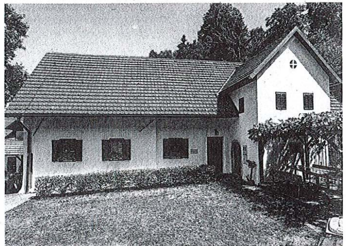
Rojstna hiša Jakoba Aljaža v Zavrhu pod Šmarno goro

Opremljanje hiše poteka že dolgo. Razstavljenih je nekaj predmetov iz obdobja, ko je v njej živel Jakob Aljaž in so tam ostali. »Si pa želimo vanjo umestiti še kakšen dodaten predmet. Ker je hiša v daljni preteklosti doživela tudi prenove, ki niso bile izvedene tako, da bi ohranile vse prvotne prostore, vračanje v prvotno stanje