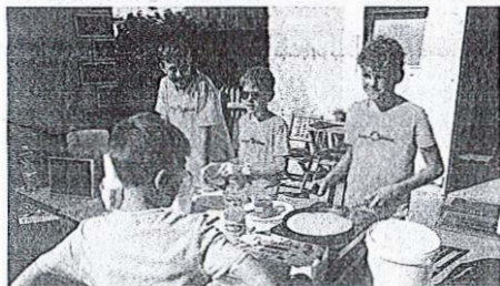
Ekipa mladih »palačinkopekov« / Foto: Alenka Brun

V minulem tednu so v kranjski porodnišnici našeli 29 porodov, od tega se je rodilo 14 dečkov in 15 deklic. Najlažja je bila deklica z 2574 grami, najtežja pa prav tako deklica s 3994 grami. Na Jesenicah se je rodilo 19 novorojenčkov, med njimi je bilo 8 deklic in 11 dečkov. Najlažja je bila deklica, ki je tehtala 2640 gramov, najtežji pa deček, ki mu je tehtnica ob rojstvu pokazala 4070 gramov.