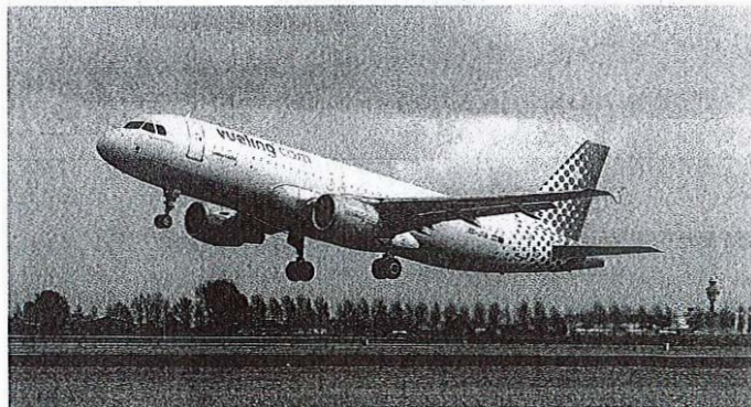
Prevoznik Vueling bo lete v Barcelono izvajal z letalom tipa Airbus A320.

bo nova povezava izboljšala potovalne možnosti za slovenske potnike ter Letališče Ljubljana uveljavila kot