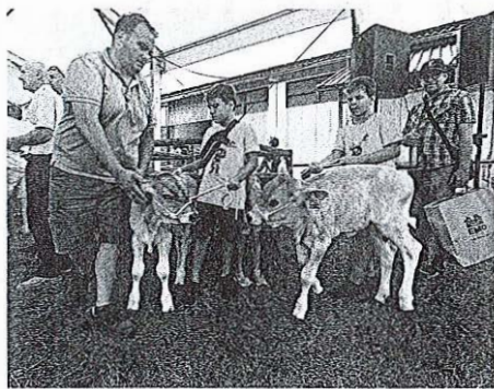
Ogledali si boste lahko tudi parade živali v maneži.

Letošnji sejem Agra bo v Gornji Radgoni osveževal z novostmi od 23. do 28. avgusta. Sejem Agra je najpomembnejši tovrstni sejem v širši regiji, praznik mednarodnega in medgeneracijskega povezovanja. Na sejmu bodo predstavljene prebojne tehnologije vodilnih svetovnih proizvajalcev in inovativnih mladih podjetij. Skupaj z državo partnerico sejma Agra, Republiki Srbijo, bo novosti predstavilo več kot 1700 razstavljalcev iz več kot tridesetih držav. Dogodek bo potekal pod častnim pokroviteljstvom predsednice Republike Slovenije dr. Nataše Pirc Musar. Na sejmu bo vsak dan predstavljenih veliko zanimivih tem, za vsakogar se bo našlo kaj. Natančnejši program najdete na www.sejemagra.si .