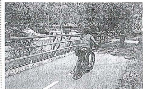
Udeleženci natečaja so vabljeni, da skozi kratke videe pokažejo svoj pogled na trajnostno mobilnost in njeno vlogo v vsakdanjem življenju.

prispevkih prikažejo vsakodnevne izkušnje, prednosti in izzive, povezane z mobilnostjo, ter izrazijo želje in vizije za prihodnost. Posebej zaželeni so prispevki, ki poudarjajo dobre prakse in osvetljujejo širši pomen mobilnosti – tako fizične kot tudi ekonomske in socialne. Natečaj je odprt za posameznike in skupine do treh avtorjev. Vsak avtor lahko odda največ tri videe, ki morajo biti dolgi od 20 do 30 sekund in posneti v pokončnem formatu. Udeležba je brezplačna, oddaja pa poteka izključno po spletu do vključno srede, 3. septembra 2025.