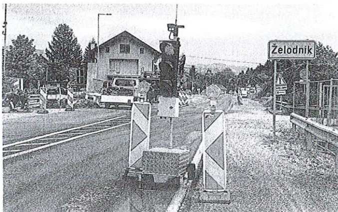
Dela naj bi bila predvidoma zaključena do konca avgusta.

Po zaključku del se regionalna cesta v svojih merah sicer ne bospremijala – dodatnih površin, kot so pločniki ali kolesarske steze, ne bo. V času del je postavljena delna zapora ceste pri objektu Želodnik 1, ki se bo glede na faze gradnje sproti premikala. Ob končni preplastitvi vozišča bo za krajši čas