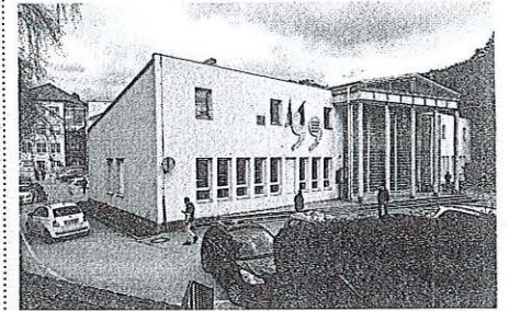
Občina Kamnik je določila višino zadolžitve tudi za energetsko sanacijo Knjižnice Franceta Balantiča Kamnik.

predvidene zadolžitve za financiranje investicij v proračunu. Ta se bo povečala z dosedanjih 2.880.000 evrov na 4.900.000 evrov, namenjena pa bo za izgradnjo kanalizacije v Motniku (milijon in pol evrov), energetsko