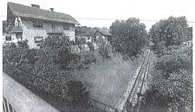
Železniško progo bodo posodobili tudi v Struževem, ne bo pa tam tovorne postaje. To zdaj načrtujejo v Naklem.

Precej pripomb in predlogov je MOK podala glede nove potniške in avtobusne postaje v Kranju. Občina je predlagala, da se razvoj potniškega terminala opravi v dveh fazah. Najprej naj se izvede gradnja novega potniškega terminala z obnovo in rekonstrukcijo postajnega poslopja, izgradnjo nadhodov, podhodov, nadstreškov, gradnjo tehnološkega objekta s prometno pisarno, rekonstrukcijo lesenega in zidanega dela obstoječega skladišča, izgradnjo parkirišč P+R ter vse dodatne posege in ureditve, ki so potrebne za funkcioniranje potniškega terminala. V drugi fazi pa bi sledila še gradnja garažne hiše, ureditev zelenih površin s paviljonom, navezavo na četrti krak krožišča na severni strani postaje ob Savskem mostu ter gradnjo novega večnamenskega objekta. Občina je med drugim posebej