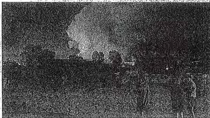
Obširen požar, ki je v prostorih proizvajalca plovil SVP Avio v industrijski coni Zapuže izbruhnil v sredo pozno zvečer, ni neposredno vplival na okolje.