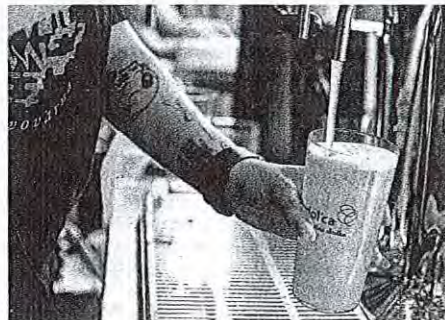
Dva dni se je v Radovljici predvsem točilo.