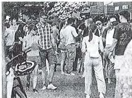
Okusi piva so v »čokoladno« mesto privabili številne obiskovalce.

Glasbeni program je lepo dopolnjeval festivalsko