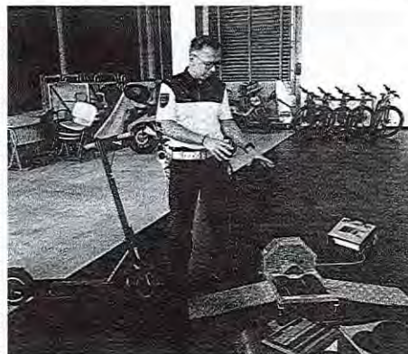
Policija uporablja posebne naprave za merjenje hitrosti pri električnih skirojih, saj teh vozil ni mogoče preveriti na tehničnem pregledu.