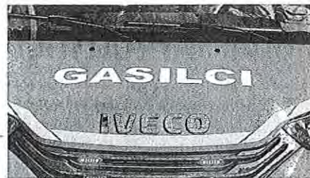
Člani Prostovoljnega gasilskega društva Duplje so letos že tradicionalno pripravili prvomajsko budnico, a so jo morali zaradi prijave predčasno zaključiti.

Kljub razočaranju gasilci niso imeli slabe vesti, saj so se trudili izvesti budnico v dobri veri in z največjim spoštovanjem do krajanov.