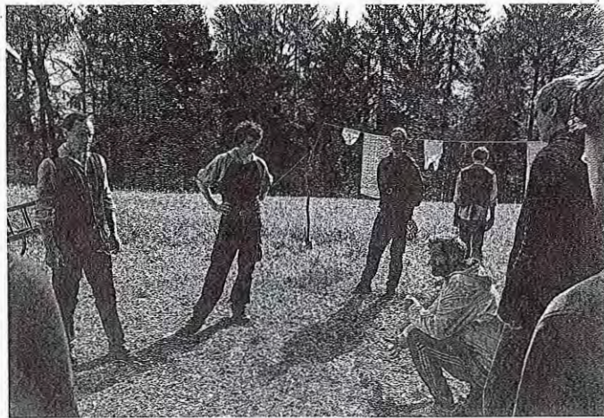
Prejšnji teden je v Medvodah padla prva klapa nove igrane serije Pošast za železno zaveso.

Igrana serija, ki nastaja pod režisersko taktirko Tomaža Gorkiča, je ena prvih igranih serij, ki nastaja s