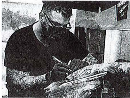
V Športni dvorani Medvode se je zbralo več kot šestdeset tetoverjev.