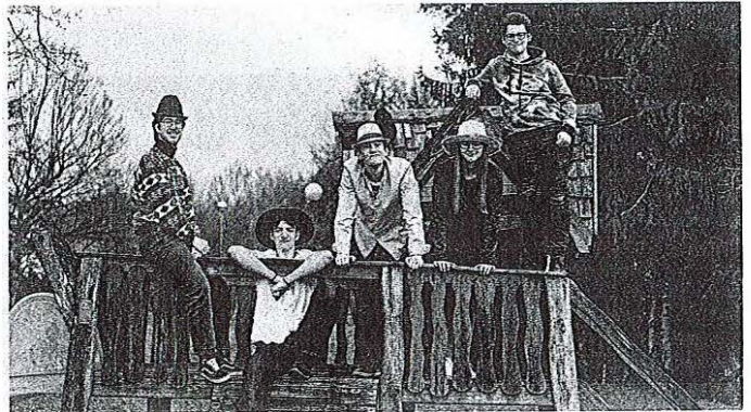
Entuziastik bend