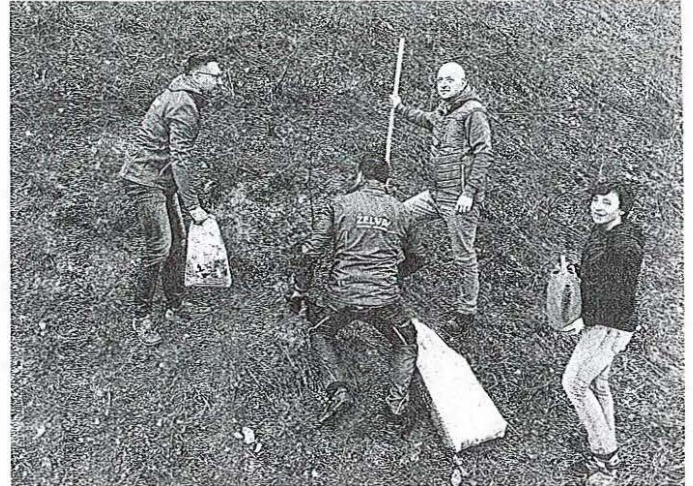
Prvo akcijo so pripravili minulo soboto, ko so posadili prve od šestdeset lip in desetih jabolan.

Prva akcija sajenja je tako potekala minulo soboto, ko so del teh sadik posadili ob kolesarski stezi, ki vodi v Industrijsko cono Trata. Sajeenje so opravili predstavniki Komunale Škofja Loka