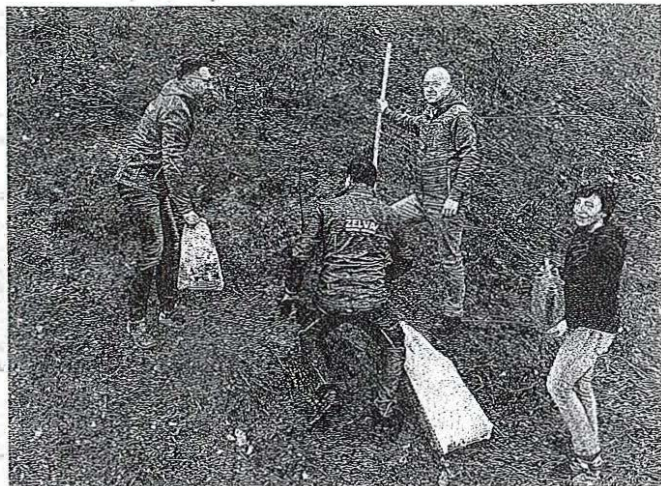
Prvo akcijo so pripravili minulo soboto, ko so posadili prve od šestdeset lip in desetih jablan.

Prva akcija sajenja je tako potekala minulo soboto, ko so del teh sadik posadili ob kolesarski stezi, ki vodi v Industrijsko cono Trata. Sajeenje so opravili predstavniki Komune Škofja Loka