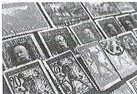
Zbirka znamk Mirka Ulapeca