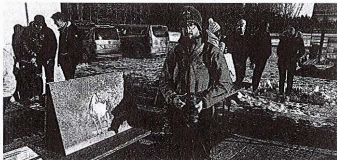
Fotografije lipicancev je na ogled postavil ljubiteljski fotograf Žiga Janhar.

Bled – V Zavodu za kulturo Bled v sodelovanju z Gorenjskim muzejem pripravljajo razstavo z naslovom Grad Khislstein in zgodbe rodbine Khisl. Odprtje razstave bov sredo, 8. januarja, ob 17. uri v dvorani nad muzejem na Blejskem gradu, razstava pa bo na ogled do konca marca 2025.