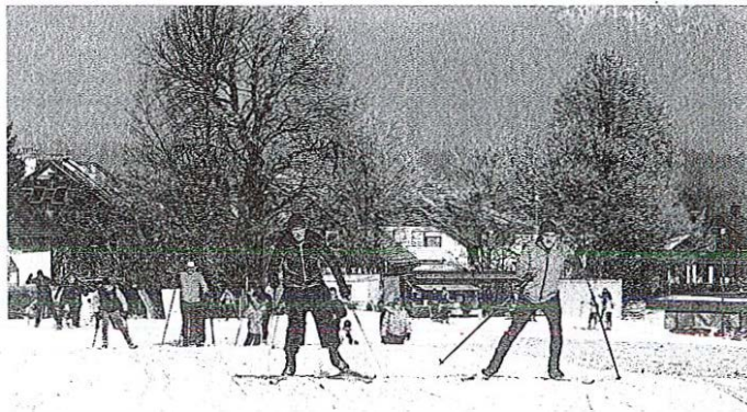
Tekaški poligon Nordijskega centra Bonovec v Medvodah je pretekli konec tedna prvič v tej zimi odprl svoja vrata in privabil številne tekače.

Obisk je bil velik – verjetno tudi zaradi posebnih