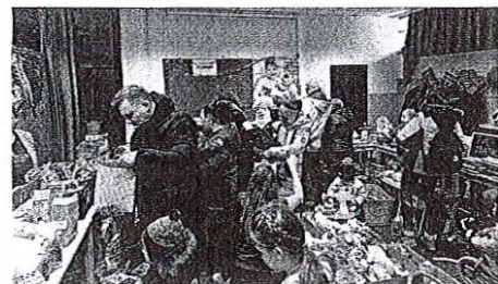
Na dobrodelnem bazarju v Podlubniku se je trlo obiskovalcev.

nakazali nekaj denarja, zdaj smo kupili srečke in še kaj lepega gremo kupit,« je povedala Nina. Z njo se strinja tudi Tone, ki je navdušen nad tem, da so mamice organizirale bazar. »Sem že kupil nekaj srečk, nimam pa majhnih otrok, da bi jim kaj kupil. Je pa včerajsin prinesel nekaj zadev, ki so danes na bazarju.« Tudi Katja je povedala, da je zares lepo, da se mamice tako angažirajo. »Vem, kako težko je organizirati tak dogodek, zato zares vse pohvale organizatorkam.«