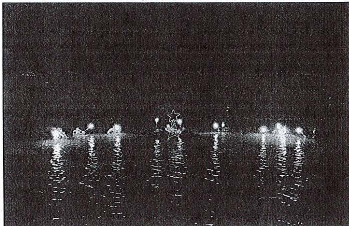
Tokrat bo božično drevesce v soju lučk žarelo pod jezersko gladino.

Ker so letos božično drevesce potapljali že petindvajsetič, je bil spremljevalni program pester. Legendo o Hudičevem borštu so tokrat številni obiskovalci spoznali s pomočjo ognjene pravljice dua Kreaktiv, ki je legendo uprizoril z ognjenim spek-