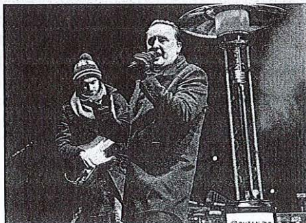
Nastop zasedbe Sam's Fever je ogrel mrzlo ozračje na obali Črnave.

lučkah ponovno zažarelo pod vodo. Spomnilaje, da so drevesce v preteklosti potapljali v jezero na drugi strani, obškarpni terase gradu Hrib, zadnja leta pa so celotno dogajanje preselili v Park Bor, a je drevesce v lučkah zažarelo zgolj na jezerski gladini. Ime prireditve so kljub temu ohranili. Letos pa so