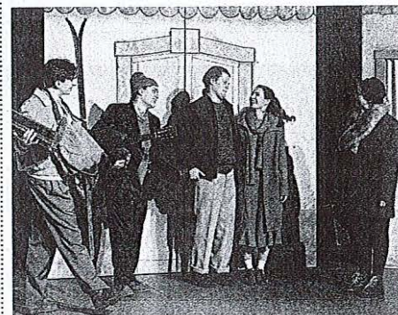
Študentje se v predstavi Ne čakaj na maj odpravijo na zimske počitnice.

Tudi današnja predstava in predstava 3. januarja sta že razprodani. Na voljo so še vstopnice za predstave 28. decembra ter 4., 10. in 11. januarja.