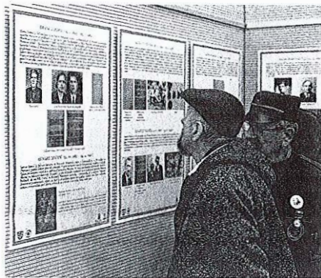
Razstava v sliki in besedi predstavlja šestdeset Maistrovih borcev iz Selške doline.

Razstava bo v galeriji muzeja odprta do konca februarja, nato pa bo po napovedih Rujca Rejca krožila tudi po drugih krajih v občini Železniki.