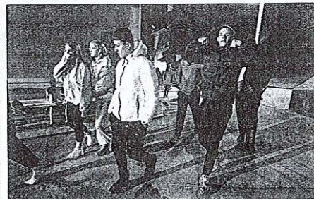
Dvainštiridesetkilometrsko pot so skupaj s postanki premagali v trinajstih urah.