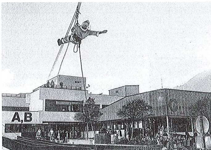
Obisk Božičkov v Splošni bolnišnici Jesenice

Med njimi sta bila tudi zgovorna Miha in Sara, ki pa ju je oba v bolnišnično posteljo položil trebušni virus. »Ni fino biti v bolnici, ker je