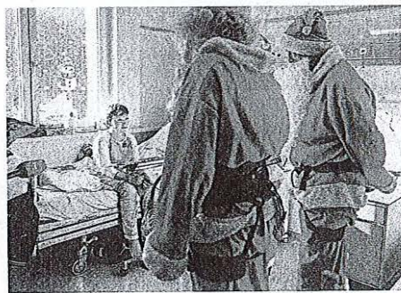
V četrtek se je na oddelku zdravilo dvanajst bolnih otrok.