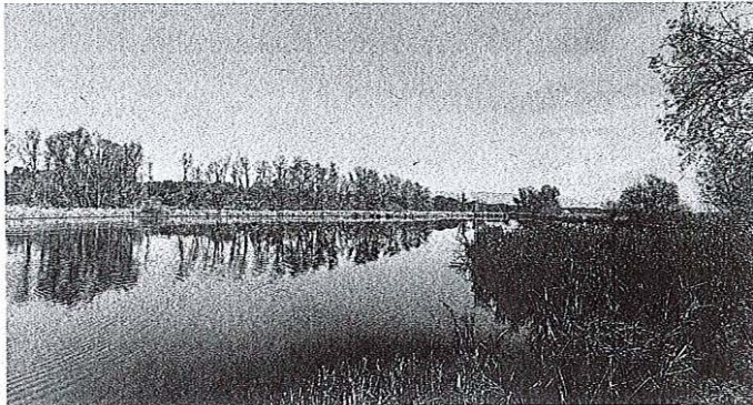
Ob Hraškem bajerju je bilo doslej zabeleženih okoli sto dvajset vrst ptic.

Hraše – Dogodek je pripravilo Turistično društvo (TD) Hraše, udeleženci pa so združili prijetno koristnim – spoznavanje narave in skrb za okolje. Dogajanje je privabilo kar nekaj biskovalcev, med njimi tudi družine z otroki. Dogodek je potekal v okviru Evropskega tedna zmanjševanja odpadkov. TD Hraše se je temu projektu priključil pred tremi leti in od takrat v tem tednu redno organizira čistilno akcijo ter spremljajoče delavnice, s katerimi ozavešča