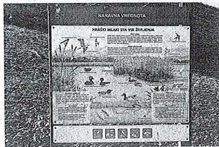
Hraški bajer je naravna vrednota in vir življenja za številne ptice in druge živali.