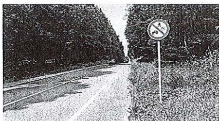
Znak o prepovedi vožnje s traktorji naj bi kmalu odstranili tudi na odseku regionalne ceste od Črničeva do Lesca.

Kot so pojasnili na direktorji za infrastrukturo,