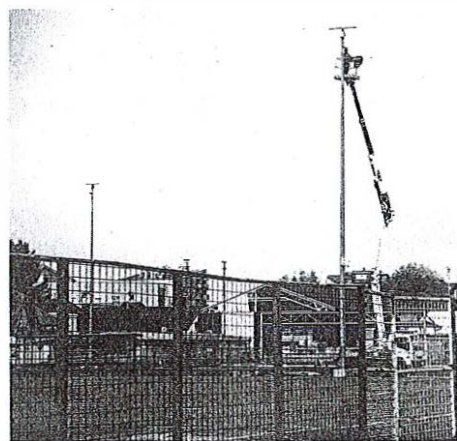
Investicije potekajo tudi v Športnem parku Domžale.

dveh novih vozil na električni pogon za javni prevoz potnikov. Kot je pojasnila