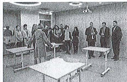
V dveh etažah so pridobili šest učilnic.

in podporo. Dejal je še, da se je Ciriusu uspelo odzvati na potrebe otrok in razvijati celosten pristop, ki je za populacijo, ki obiskuje center, posebnega pomena. »Verjamem, da razvoj tudi v prihodnje ne bo izostal,« je še