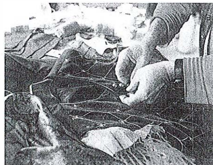
Krojaški mojster šiva celotno moško galanterijo, tudi narodne noše.

z ameriški vojniki, a gospodje so dotlej vedno nosili naramnice,« navzve še eno zanimivost.