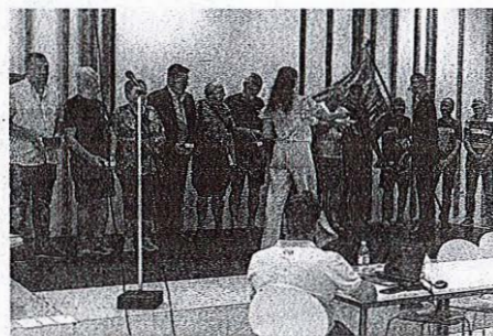
Slavnostna akademija ob 70-letnici Ribiške družine Medvode je potekala 7. septembra 2024 v prostorih Osnovne šole Vižmarje - Brod.

RD Medvode danes šteje okrog 140 članov, ki pa so v večini iz ljubljanskega območja. Čeprav je število članov iz medvoškega okoliša upadlo, predsednik ostaja optimističen. »Če bodo habitati v Sori s pritoki in v Savi še omogočali, da se bodo ribje vrste v njih dobro počutile, potem za prihodnost ribištva v medvoškem ribolovnem okolišu ni bojazni,« zaključuje Zajc.