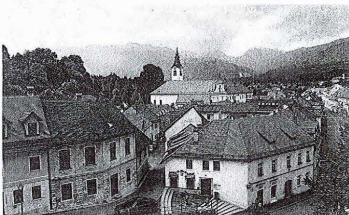
V Kamniku so sprejeli druge spremembe in dopolnitve občinskega prostorskega načrta. Fotografija je simbolična.