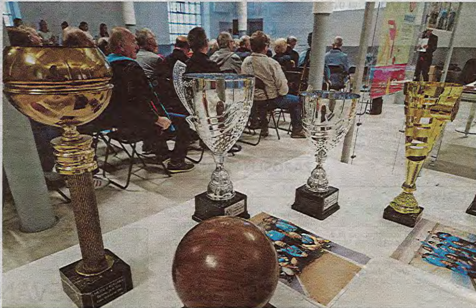
O dosežkih tržičkih kegljačev pričajo tudi številna odličja. Nekatera med njimi si je bilo mogoče ogledati tudi na razstavi.

Tržič – Praznovanje obletnice je združilo tako pretekle kot sedanje člane kluba ter širšo skupnost, ki že desetletja podpira razvoj kegljaškega športa v Tržiču. Jože Klofutar je med predstavitvijo zbornika poudaril, da je ideja o zapisovanju zgodovine kluba nastala že ob njegovi 50-letnici, a se je delo uresničilo šele ob 70-letnici. »Večji del vsebine zbornika je bil pripravljen že ob 50-letnici, vendar takrat ni prišlo do realizacije. Zdaj pa me je najbolj spodbudila profesorica Jožica Koder, ki je dejala, da bi bilo neodgovorno, če tega delane dokončam,« je pojasnil Klofutar. Po njegovih besedah zbornik ne zajema le zgodovine kluba, temveč je pomemben del zgodovine Tržiča in celotnega kegljaškega športa v Sloveniji. Začetki kegljanja v Tržiču so bili, kot poudarja Klofutar, precej skromni. »Leta 1953 ni bilo niti fotoaparata, da bi lahko dokumentirali dogajanje,« je dejal, pričemerje poudaril, da je prva fotografija kluba iz leta 1963. V zadnjih desetletjih pa je arhiv postal izjemno bogat, a ga zaradi