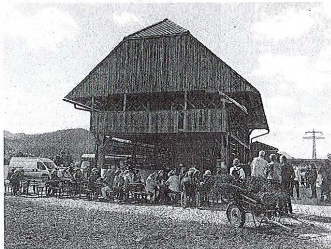
Jesen pod Črnetovim toplarjem je privabila številne obiskovalce, ki so na nedeljsko popoldne uživali v prijetnem druženju.

Za zabavo najmlajših so poskrbeli z otroško ustvarjalnico in poslikavo obraza, za glasbeno popestritev je nastopil mešani pevski zbor Srebrne zvezde, ki deluje pod okriljem Društva upokojencev Pirniče, manjkala pa ni niti pestra stojnična ponudba, v okviru katere so obiskovalci lahko uživali v izdelkih iz ajde, našle pa so se tudi druge domače dobrote, kot so jogurti, siri, salame, čaji in še in še.