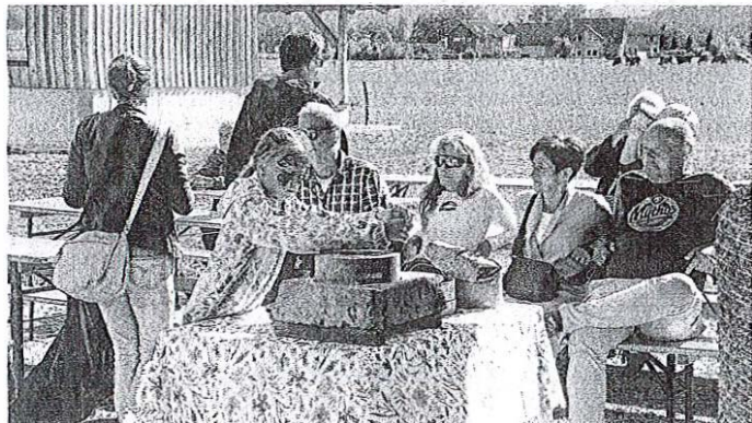
Preizkusiti se je bilo mogoče tudi v mletju ajdovih zrn, kar je zanimalo predvsem najmlajše.

udaril pomen ohranjanja tradicije in lokalnih pridelkov, kot je ajda, ki kljub svoji skromni zgodovini zasluži pridobiva veljavo v sodobnem svetu.