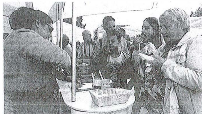
Festival kranjske klobase je v Medvode privabil veliko obiskovalcev.

Festival kranjske klobase bodo pripravili tudi v prihodnjih dveh letih, ko bo še potekal projekt Zaščitena okus Evrope – kranjska klobasa.