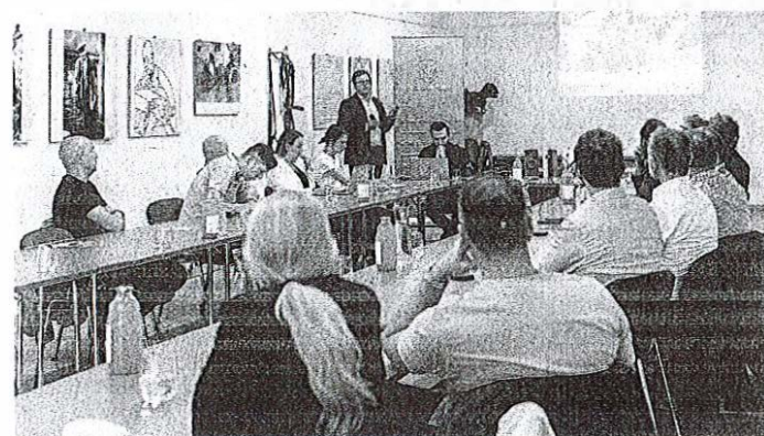
Predstavitve projektov in načrtov Občine Medvode