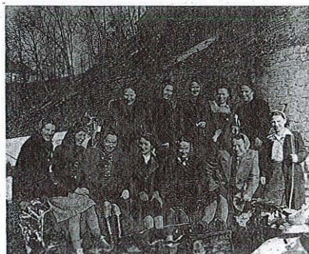
Delovna akcija članic AFŽ (1945)

se pododloku mestnih oblasti v akcijo vključili vsi prebivalci Radovljice. Razdeljene po ulicah našega domovanja so nam odredili območje njiv s krompirjem, ki smo jih morali pregledovati vsako nedeljsko dopoldne.