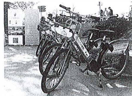
V Medvodah so spomladi vzpostavili sistem izposoje e-koles MedvođEK s štiri postajami in desetimi e-kolesi. Kot pojasnjujejo, se pripravlja projekt regijske mreže s 16 postajami v Medvodah in 70 e-kolesi.