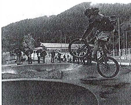
Odpri grbinastega poligona so s prikazi popestrili člani Gorskog kolesarskega kluba MTB Železniki.

Dogodek, ki ga je žal spremljalo slabo vreme, so s prikazi na poligonu popestrili še člani Gorskog kolesarskega kluba MTB Železniki.