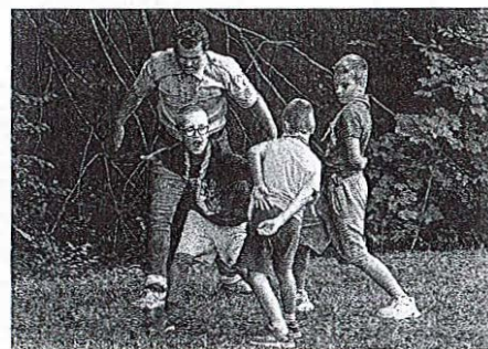
Ob praznovanju jubileja so pripravili tudi delavnice za otroke.

V govoru je spomnil, da so taborniki nekoč delovali v prostorih v središču Medvoda, nakar jim je občina v uporabo predala omenjeno hiško. Dodal je, da sosednje zemljišče ni bilo v občinski