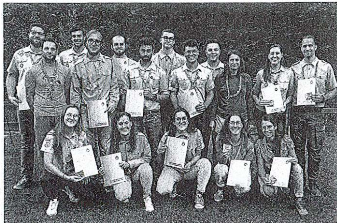
Prejemniki srebrnih in bronastih priznanj za deset oziroma pet let aktivnega delovanja.