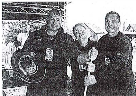
Letos so najboljši grajski lonec skuhalo člani Turističnega društva Žlebe - Marjeta.

Ko zaspis, ki je namenjena njuni hčerki Lori, je Tjaša razkrila: »Midva sva si prav ta koncert, prav naslednjo pesem in prav vas, drago občinstvo, izbrala, da z vami premierno deliva to veselo novico. Danes na odru nisva dva, ampak smo trije! Dojenčka bomo imeli!« Sledil je bučen aplavz in pri marsikom tudi solze sreče. »Po rojstvu se bova za nekaj časa poslovila od koncertnih odrov, zato konec leta začenjava prav posebno Babyshower turnejo. Koncerte bova začela prirejati decembra in jih končala na valentinovo.« Obiskala bosta Gorenjo vas, Kostanjevico na Krki, Ža-