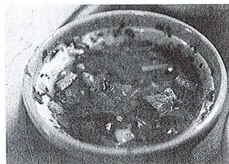
Grajski lonec je jed iz mesa in zelenjave.