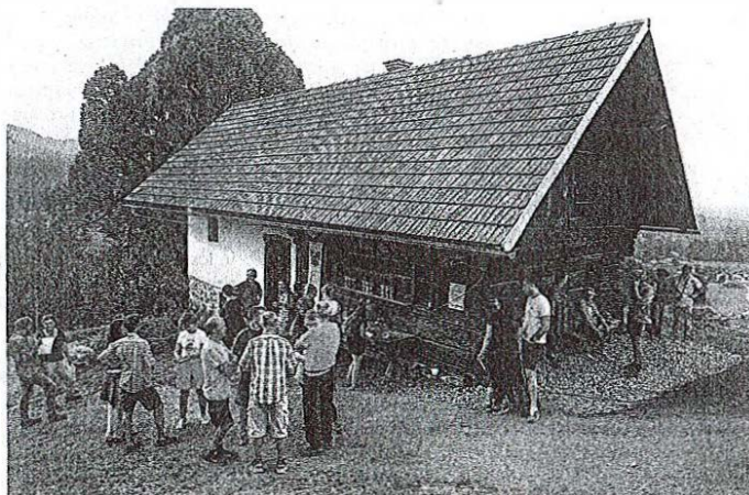
Nekdanja mežnarija je v okviru Hiše na hribu postala prostor ustvarjanja, povezovanja, razstavljanja ...

Srce projekta je v nekdanji mežnariji pri sveti Marjeti, kjer je Zvonka T. Simičič odraščala. Na začetku se je počutila kot tista mala deklica, ki je delala prve korake, je med drugim obelodanila v pogledu na prehojeno pot, ki je porajala smeh in veselje, pa tudi jok, hrepenenje, raziskovanje ... »Pot skupnosti zahteva čas. In ni in ne more biti samo utrinek. Ko