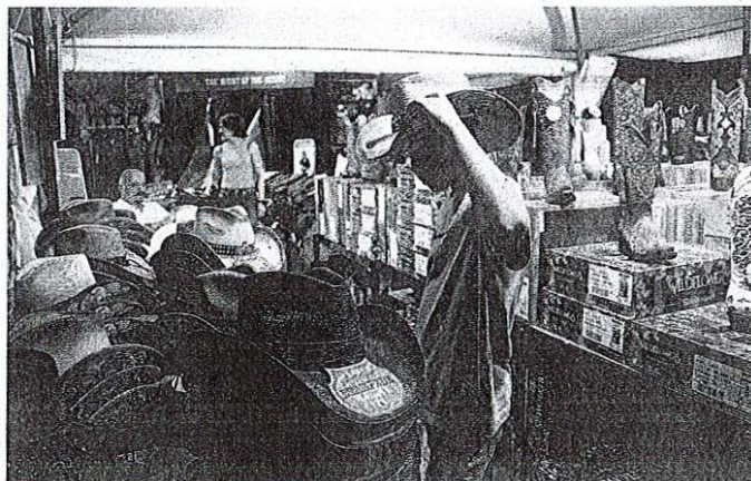
Na stojnicah je obiskovalce pričakala pestra ponudba kavbojskih klobukov, škornjev, oblačil iz džinsa ...