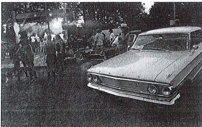
Wild West Fest (On Fire) na prireditvenem prostoru ob Zbiljskem jezeru združuje vse, kar je vezano na ameriški Divji zahod.

Organizatorji pravijo, da prireditev ostaja v Zbiljah, čeprav si jo želi tudi Ljubljana. »Dokler Zbilje ne bodo pokale po šivih, ostajamo na tem lepem prizorišču,« je zagotovil Tacol.