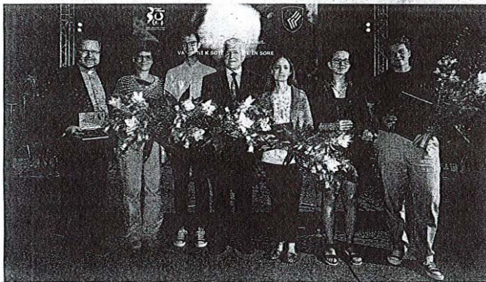
Letošnji nagrajenci Občine Medvode