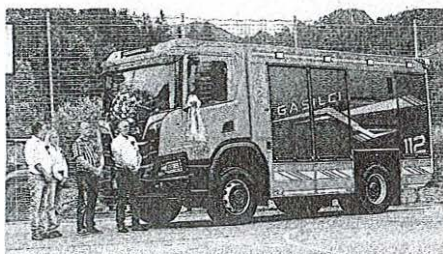
Gasilci v Šmartnem so bogatejši za novo gasilsko vozilo.