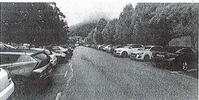
V Kamniku se obeta posodobitev sistema parkiranja

Uporabniku omogoča, da z uporabo pametnega telefona uredi parkiranje, po potrebi tudi na daljavo podaljša čas parkiranja in na koncu poravnava račun. Sistem je povezan z upravljavcem parkirišča, zato redarji vidijo, da ima določeno vozilo aktivirano parkirno, in ne izrečejo globe. Kljub temu pa bodo v Kamniku še vedno omogočali tudi plačevanje z gotovino, kot je to veljalo doslej. Kot pravi kamniški župan, bodo cene ostale na podobni ravni. Danes u.a. parkiranja na plačljivih parkiriščih v mestu stane pol evra.