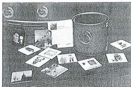
Spomin #medvodami sestavlja trideset reprezentativnih elementov občine Medvode.

Festivalski program je tudi sicer odseval obletnico občine; zavod Sotočje je vanj vnesel značilno trojnost: industrija–trško jedro–narava. Obiskovalce so med drugim povabili na soden ogled razstave o knjiznici,