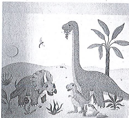
Svet dinozavrov je poslikava, ki jo je Sofija Polak zaključila pred nekaj dnevi.

kako se poda nanjo, proporce. Poslikave se vedno prilagaja prostoru, prostor se ne bo podredil poslikavi.« Želi si, da bi začela v prihodnosti slikati na formate večjih dimenzij, dva metra krat meter in pol. »Da bi lahko svoje ustvarjalne zgodbe obelodanila, se mi zdi edino logično, da začnem slikati na platno. Ker platno se lahko zvije in pošlje. Do zdaj sem naredila samo enega: morski svet. Zdaj imam načrt naslikati cvetlice, ko bom podelala vsa naročila. Na primer magnolije. Sploh za kake kuhinje. Ali kak velik cvet. Ne majhnih, ti se izgubijo. Močne, velike, na primer veliki bel cvet in zelenje s pastelnim tonom za ozadje.«