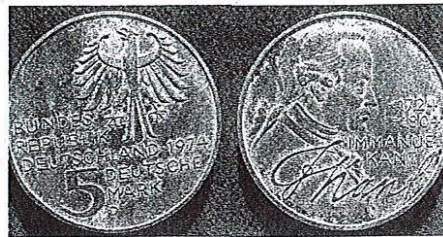
Kantov portret in podpis na srebrniku, ki so ga izdali v ZR Nemčiji leta 1974, ob 250. obletnici njegovega rojstva