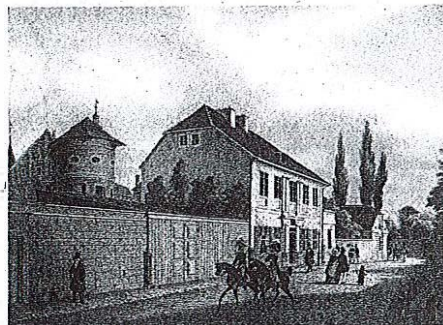
Kantova hiša v Königsbergu na sliki iz leta 1842. Iz nje je šel vsak dan ob isti uri na sprehod in se natančno osemkrat sprehodil gor in dol po tej ulici.