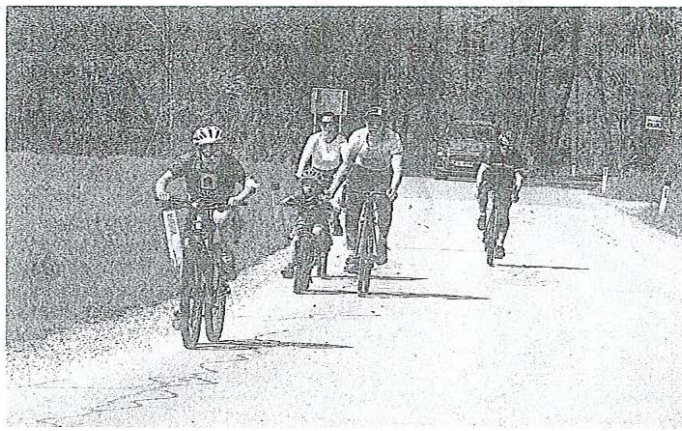
Sončno in toplo vreme so mnogi izkoristili za aktivnosti na prostem.