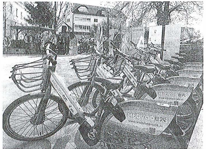
Novosti so v uporabo predali na prireditveni ploščadi ob Tržnici Medvode, kjer je tudi eno od štirih postajališč za električna kolesa.