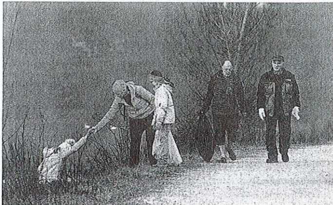
Očiščevalne akcije v Zbiljah se udeležijo krajani vseh starosti.