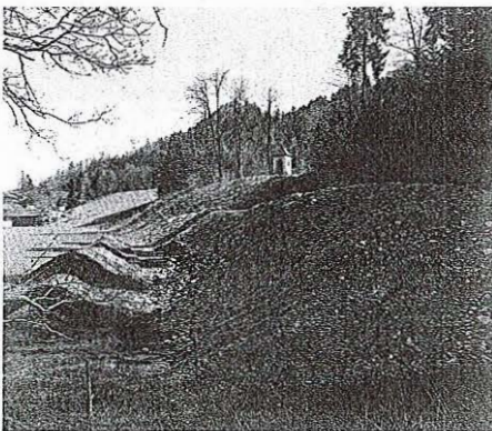
Sanacija plazu v bližini Dvorca Visoko

brežine, da bi bila mogoča strojna obdelava površine,« je razložil župan Milan Čadež in dodal, da je bilo doslej omenjeno brežino težko vzdrževati, saj jo je prerasčala glomazna travna. Po tem, ko bodo zmanjšali naklon, ima občina v načrtu na tem mestu urediti letno gledališče, je še razkril župan.