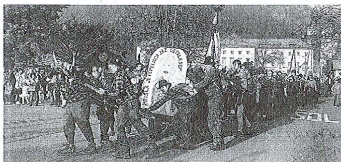
Takole so neporočeni lani odvlekli najlepšo smreko iz doline Drage skozi Begunje in si povrnilo ugled.