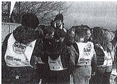
Predstavnica Policije je otroke seznanila s pravili varnega smučanja.

»Otroci so radovedni, radi preizkušajo nove stvari. V