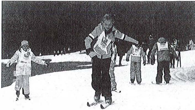
Sodelovanje v akciji marsikomu omogoči prvo izkušnjo teka na smučeh.

Interes za sodelovanje v akciji je velik, letos je prijave oddalo 61 šol: 1800 mest za učenje alpskega smučanja, namenjeno učencem četrtilih razredov, in 1400 mest za tek na smučeh, v katerega vključujejo tretješolce, so po besedah Francija Petka, direktorja Zavoda za šport RS Planica, zapolnile v slabepol