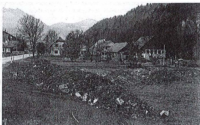
Na seznamu za odstranitev je tudi osem objektov na Gorenjskem, po eden v občini Cerklje na Gorenjskem, Medvode in Trzin, dva v občini Gorenja vas - Poljane (na fotografiji) in trije v kamniški občini.

Družini Zgonec in Šubic z Gorenje Dobrave v občini Gorenja vas - Poljane, katerih objekti so se prav tako znašli na seznamu za odstranitev, so že leta 1978 prisilno preselili na trenutno območje, ko so na mestu, kjer so živeli prej,