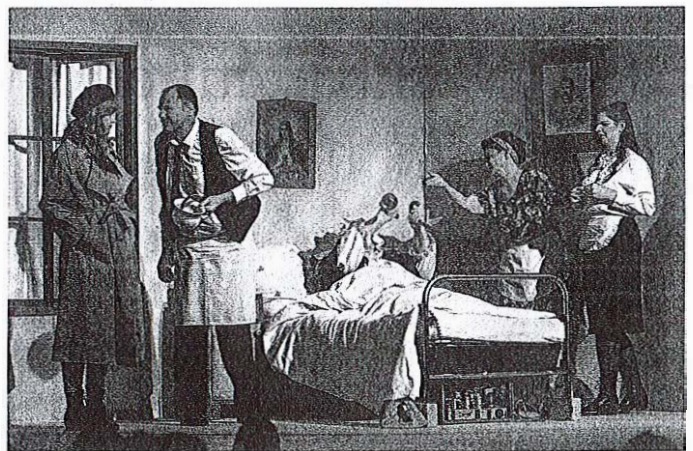
Zgodba postreže s številnimi zabavnimi zapletmi.