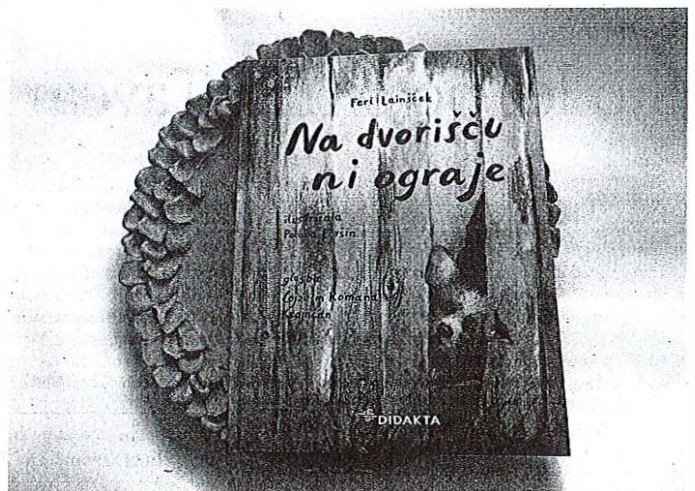
Najprej so bile pesmi, potem predstava, zdaj je tu še knjiga in zgoščanka z uglasbenimi pesmicami.